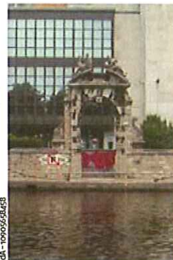
Le square réaménagé serait une nouvelle porte pour une convivialité namuroise en bord de Sambre...

C'est un appel à animations et actions culturelles. Il est important pour le développement et le positionnement de