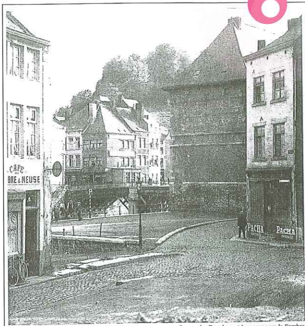
La rue des Bouchers et la rampe vers la Sambre.