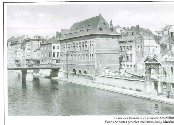
La rue des Bouchers en cours de démolition.