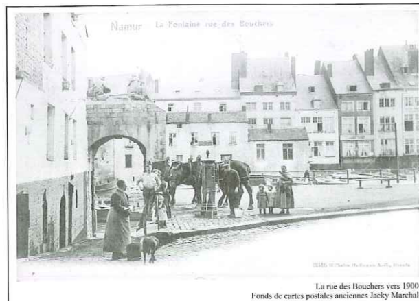
La rue des Bouchers vers 1900.